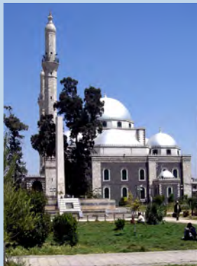
„Wissen & Genießen“

Der Name Syrien kommt aus dem Griechischen, das den alten Namen Assur übernommen hat. Die ältesten archäologischen Funde auf dem Gebiet des heutigen Syriens sind ca. eine Million Jahre alt. Nach der Eroberung durch Alexander den Großen gehörte Syrien von 301 bis 64 v. Chr. zum Seleukidenreich. Im Römischen Reich (ab 64 v. Chr.) war Syria neben Aegyptus die reichste Provinz des Imperiums. Die oströmische Herrschaft endete im 7. Jahrhundert n. Chr. mit der Eroberung durch die arabischen Ommajaden. Die Syrer kennen unendlich viele Variationen von Vorspeisen, z.B. Hommus bi Tahina (Kichererbsen-Sesam-Dip), Tabouleh (Salat aus Tomaten, sehr viel Petersilie und geschrotetem Weizen), und Babaganouj (Aubergine, Sesampaste, Zitrone und Knoblauch). Dazu gibt es z.B. Thymianbrot. Zu den beliebten Hauptgerichten gehören z.B. Huhn und Lamm auf Spießen über Holzkohle gegrillt und Kibbeh (aus Weizenschrot, Hackfleisch und Zwiebeln), Falafel (frittierte Kichererbsenbällchen), Bohneneintopf oder Reis mit Pinienkernen und Gemüse.